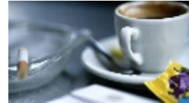
אני מכור – אין מה צבלין שחורים יודעים