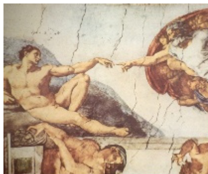
אדם הראשון עם טבור? היתכן שמיכאלאנג'לו פספס?

על אף חוסר השימושיות הטבור הוא אחד מחלקי הגוף הראשונים שתינוקות לומדים לקרוא להם בשמם. במרכז של תקרת הקפלה הסיסטינית בוותיקן מצוירת אחד מפסגות האמנות האנושית: בריאת האדם של מיכלאנג'לו. אדם שזה עתה נברא מן העפר מקבל את רוח החיים מהאל ועל בטנו, אף שלא יצא מרחם ולא התחבר לשלייה, מתנוסס טבור. אי אפשר לחשוך באמן או במזמין העבודה, האפיפיור יוליוס השני, בבורות תנ"כית אלא שהטבור הוא