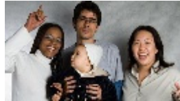
אל תקרא לי שחור