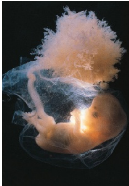
השאריה המדולדלת נופלת כעבור כשבוע ומותירה את הטבור כמזכרת