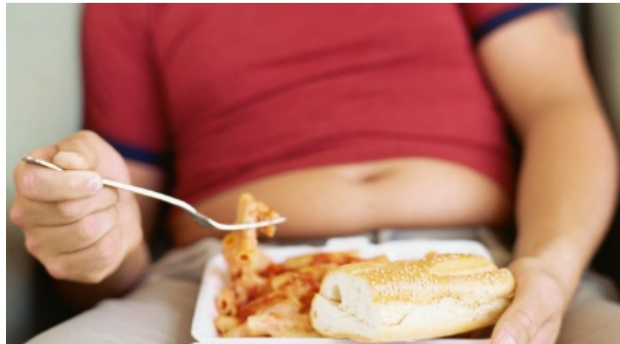
הטבור וקפלי העור סביבו זזים עם הבטן כולה וצורתו משתנה עם הגיל והמשקל